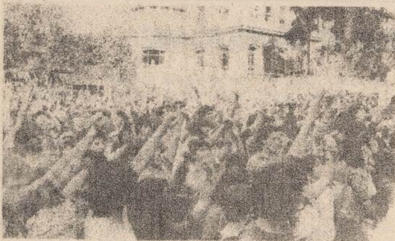
CON EL PUÑO EN ALTO, VOCEANDO CONSIGNAS EN INGENIERIA

Un promedio del 70% de los universitarios pararon sus actividades el 12 de abril en la U y UC en Santiago, y en otros establecimientos del país. El paro fue convocado para exigir la democracia en el país y en las universidades, así como el término de la represión y el fin de los rectores delegados, además de preparar las fuerzas estudiantiles para el Paro Nacional, Obrero y Popular. En Santiago, el día 12, se realizaron asambleas en casi todos los planteles de la enseñanza superior, hubo manifestaciones en el centro (con 12 detenidos), marchas en los campus Oriente y San Joaquín de la UC, y un acto central en la Facultad de Ingeniería de la U. donde participaron alumnos de todas las universidades de la capital y estudiantes secundarios. También se realizaron mítines en diversas regiones, destacando las ciudades de Concepción y Valparaíso, en la cual las manifestaciones se prolongaron hasta el anochecer, con 38 detenidos. En La Serena los estudiantes efectuaron desfiles callejeros, mientras que en la U. del Norte, en Antofagasta, 200 alumnos interrumpieron la clase magistral con que el presidente de